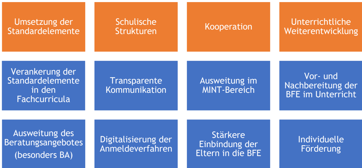
Abbildung 3: Ausrichtung und Ziele der Studien- und Berufsorientierung

Die nachfolgende Übersicht illustriert die aktuellen Schulentwicklungsvorhaben. In der oberen Reihe sind die Kategorien dargestellt. Darunter befinden sich die jeweils in Angriff genommenen Teilziele.