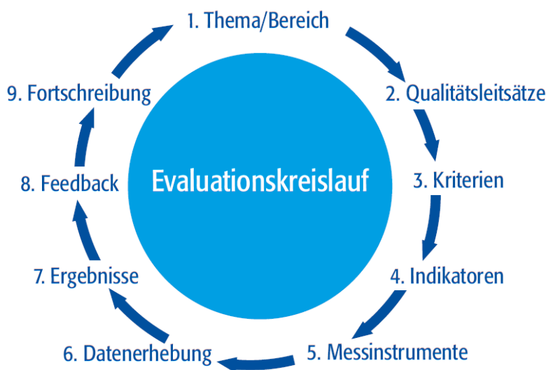
Abbildung 2: Evaluationskreislauf nach Miethner (2005), Qualitätsprogramm der Evaluation

Dokumentation: Der gesamte Evaluationsprozess wird ausführlich (auf MS-Teams; im Zusammenhang mit Konferenzen auf Logineo) dokumentiert, um eine Metaevaluation zu ermöglichen.